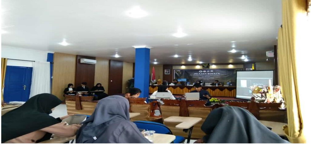
Gambar 4. Pemberian materi dari bpk verbri al intani selaku budayawan palembang