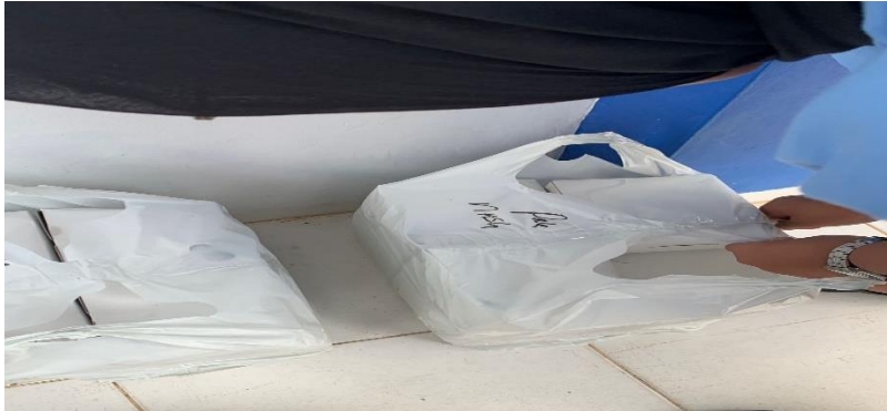
Gambar 1 Snack VIP dan Snack Peserta