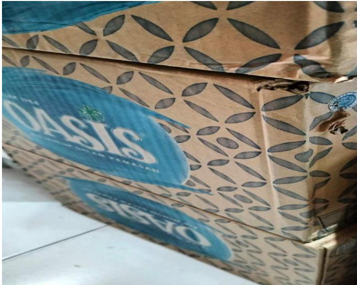
Gambar 3 Aqua Dus Cup