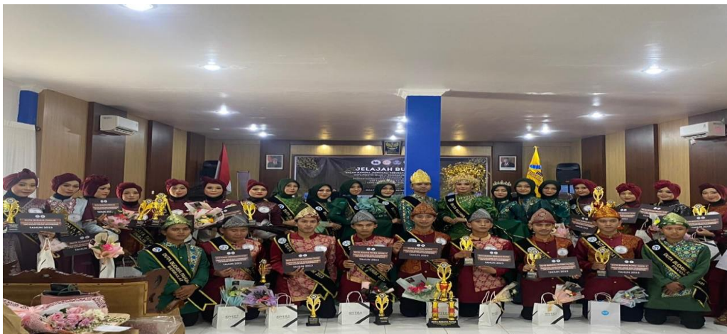
Gambar 6 pemenang duta budaya