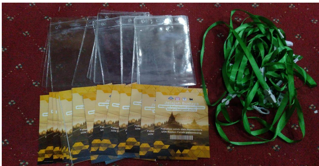
Gambar 5 aidicart