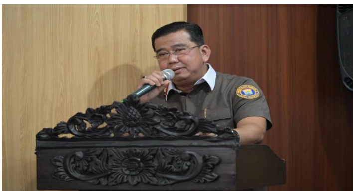
Gambar 3. Pemberian materi dari kepala dinas pariwisata