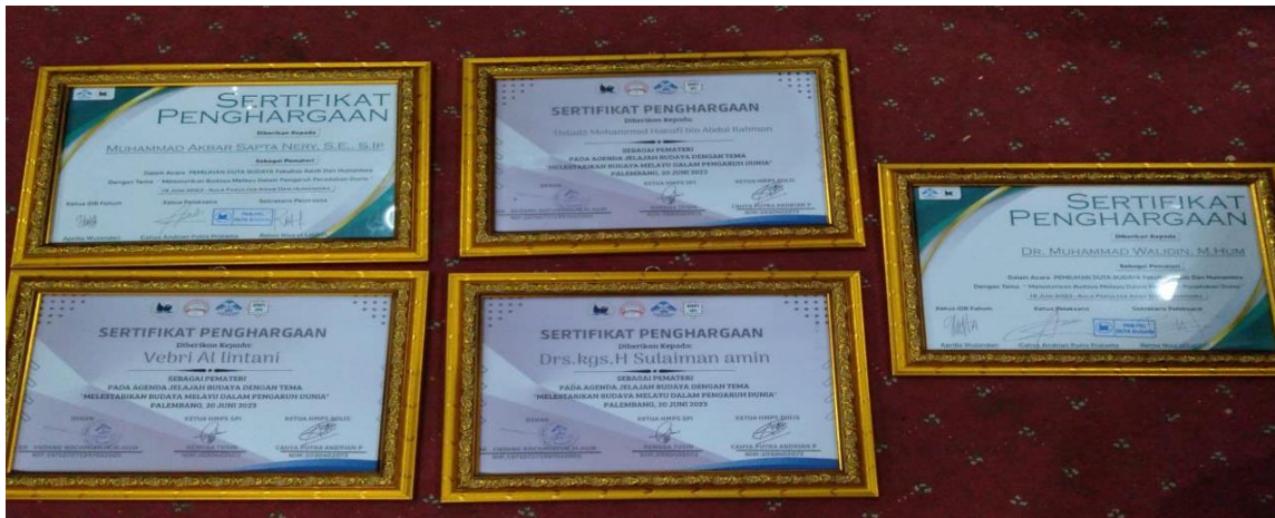
Gambar 4 bingkai