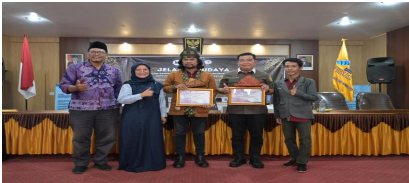
Gambar 5. Penyerahan piagam penghargaan kepada pemateri