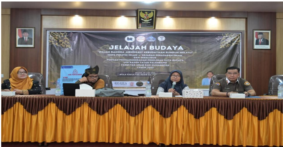
Gambar 2 Baner