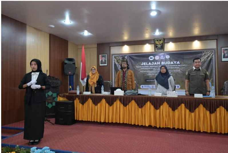
Gambar 1. Pembukaan